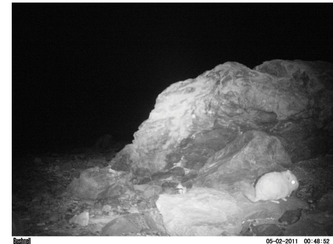
FIGURA 2.- Ejemplar de chinchilla de cola corta ( Chinchilla chinchilla ) fotografiado mediante una trampa-cámara en la Cordillera de Los Andes de la Región de Atacama.

La metodología consistió en un muestreo dirigido hacia zonas de refugio (roquedales) de mamíferos como roedores y carnívoros instalando 40 unidades de trampas-cámara en distintos sectores dentro del área de estudio. Frente a cada trampa se colocaron atrayentes específicos para carnívoros ( i.e. , orina de linco) y para micromamíferos ( i.e. , avena y manzana) y se dejaron activas durante períodos de entre 2 y 157 noches consecutivas. Las trampas fueron instaladas en sitios de roqueríos y de preferencia cercanos a cursos de agua o bofedales o con estrato herbáceo y arbustivo, seleccionando los lugares en función al registro de signos de presencia de carnívoros y/o micromamíferos ( i.e. , huellas, heces). En cinco de los sitios adicionalmente se recolectaron muestras de heces o crotines los que se hallaban en defecaderos de roedores, las que fueron llevadas al laboratorio de genética molecular de Juan Carlos Marín, de la Universidad del Bío Bío para su análisis genético y determinación de la especie.