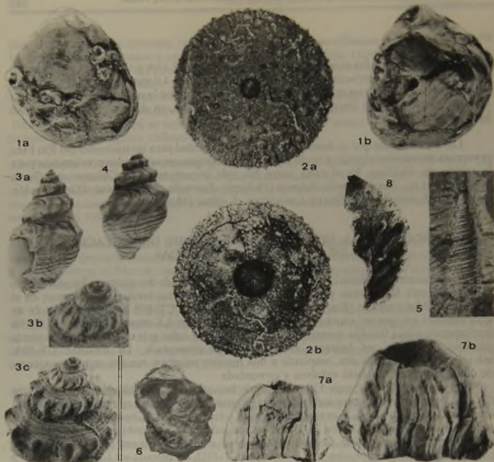
Lámina 1, Figuras.