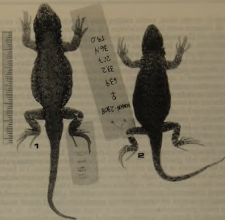
Fig. 1. Alotipo de Liolaemus rosenmanni n. sp. (DBGUCH-916). Fig. 2. Holotipo hembra (MNHNC-2308).