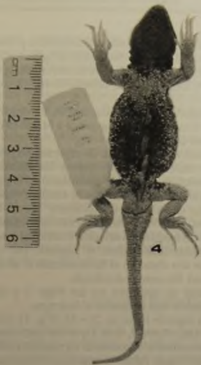
Fig. 4. El alotipo en vista ventral; nótese las áreas melánicas de la región gular y del vientre. (Escala gráfica en mm ).