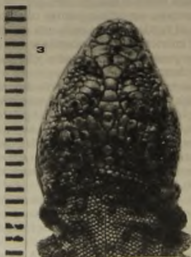
Fig. 3. Vista dorsal de la cabeza del paratipo DBGUCH-915, mostrando los cuatro azigos frontales en línea. (Escala gráfica en mm).