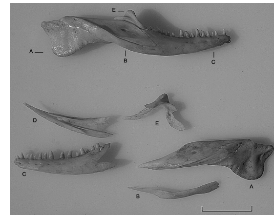
FIGURA 2. Mandíbula de Callopistes maculatus , arriba mandíbula derecha, imagen inferior desarticulada. A, articular, B, angular; C, Dentario; D, esplenial; E: coronoides.

De los restos del cráneo se conserva el frontal (Figura 1G), la parte posterior del cráneo (Figura 1E), el Cuadrado (Figura 1D) y ambos maxilares (Figura 1H), el derecho presenta 14 piezas dentarias, falta sólo la pieza número 10; en el maxilar izquierdo están ausentes las piezas números 6, 8 y 10 de un total de 15. Del aparato esternal se conserva la interclavícula (Figura 1F), y el escápulo coracoides, además de las clavículas.