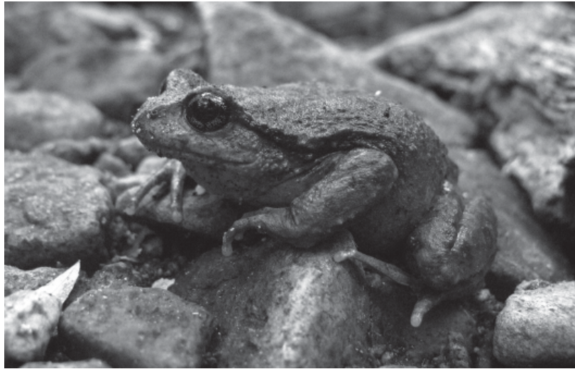
FIGURA 1. Alsodes hugoi Cuevas y Formas, 2001; hembra observada en Vilches Alto

Este trabajo tiene como objetivo recopilar información respecto a los tipos de hábitat utilizados por individuos reproductivos de A. hugoi ; de manera tal de aumentar el conocimiento que se tiene respecto al rango de distribución altitudinal de la especie, los hábitats que utiliza y las especies de anuros simpátricas con las que habita.