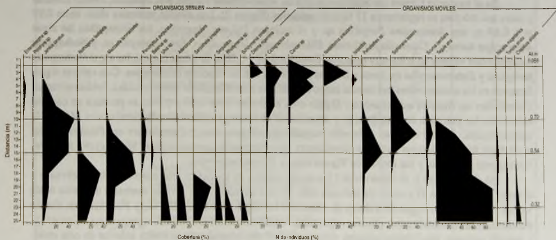
FIGURA 3. Transecto 2.