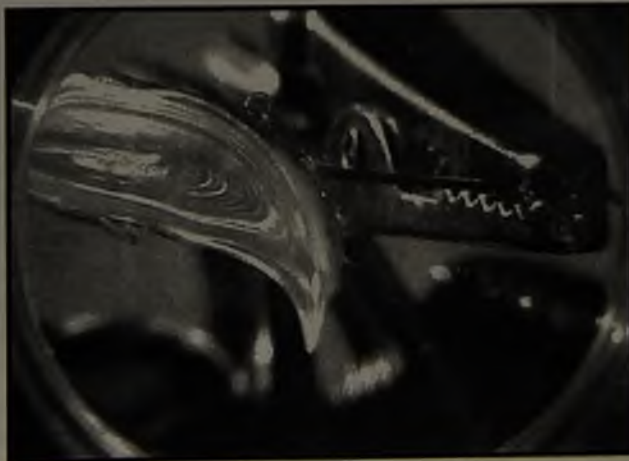
FIGURA 4. Hemidiente de GPSV-008, tratado mediante desgaste ácido.

La técnica empleada de desgaste ácido, fue satisfactoria y recomendamos su utilización por ser ésta una simplificación funcional y de bajo costo (US$ 1 por pieza dentaria).