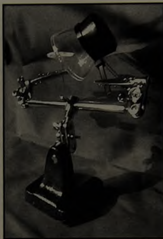
FIGURA 3. Montaje de las piezas dentales tratadas, para análisis directo.