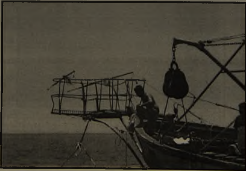
FIGURA 6. Pesquero en prospecciones de centolla, con arpones montados.

Durante el período de este estudio, registramos la presencia de embarcaciones pesqueras dentro del área de reserva artesanal: "Chacabuco III" (en faenas con su pareja), "Don Mateo", "María Yanet", "Tía Blanca", "Abuelita Carlina", y "Quintrala" entre otras. Algunos tripulantes desembarcaron ilegalmente y regresaron portando sacos con contenido desconocido,