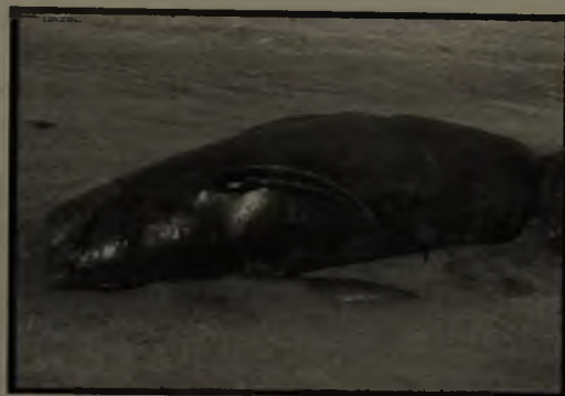
FIGURA 1. Calderón de aleta larga, Globicephala melas , encontrado varado en la III Región de Chile.

Un pescador describió haber observado el ejemplar de Globicephala melas nadando dificultosamente en la cercanía de la caleta, un par de días antes de ser encontrado varado, con un elemento clavado en su dorso.