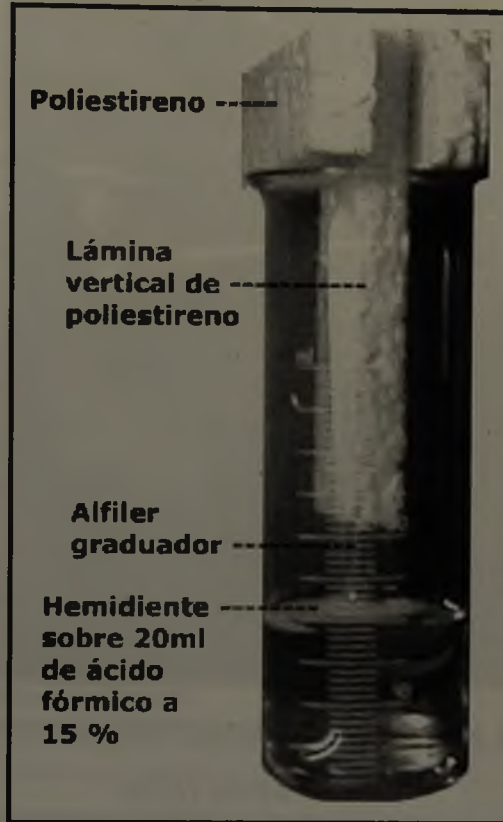
FIGURA 2. Montaje de piezas dentales para desgaste ácido.