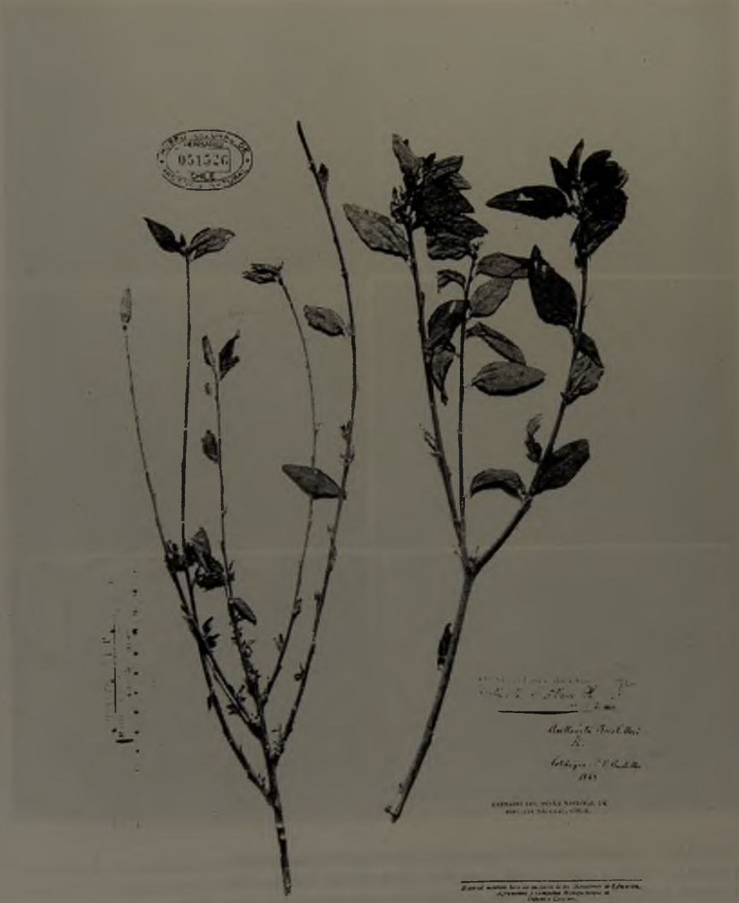
FIGURA 1. Avellanita bustillosii . Ejemplar Tipo, SGO 51526