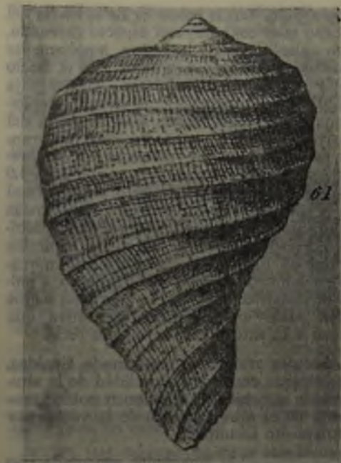
Fig. 10. Ficus distans (SOWERBY). Holotipo. Figura original del autor (SOWERBY 1846, lám. 4, fig. 61). Vista dorsal (x2).

SGO.PI. 3266. Un ejemplar en buen estado de conservación. Navidad, Colección PHILIPPI. Corres-