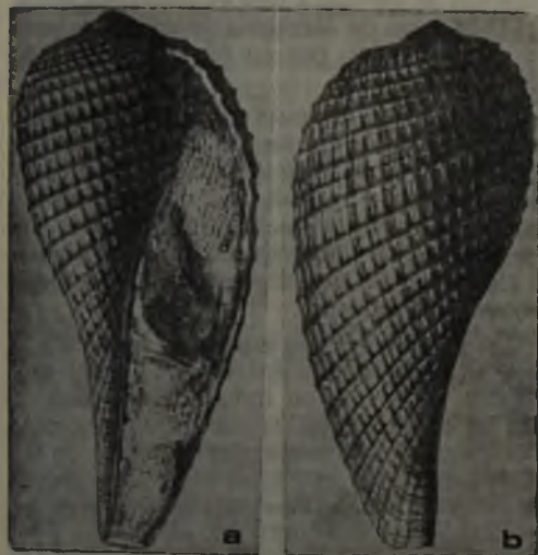
Fig. 9. Ficus carolina (d'ORBIGNY). Holotipo. Figura original del autor (d'ORBIGNY 1847, lám. 2, figs. 34 y 35) a: vista apertural (x1). b: vista dorsal (x1).

según especímenes provenientes de Navidad [?] y de la boca del río Santa Cruz, Patagonia argentina. Debido a que las estrías de crecimiento indicaban que sus ejemplares eran menos alargados que el figurado por