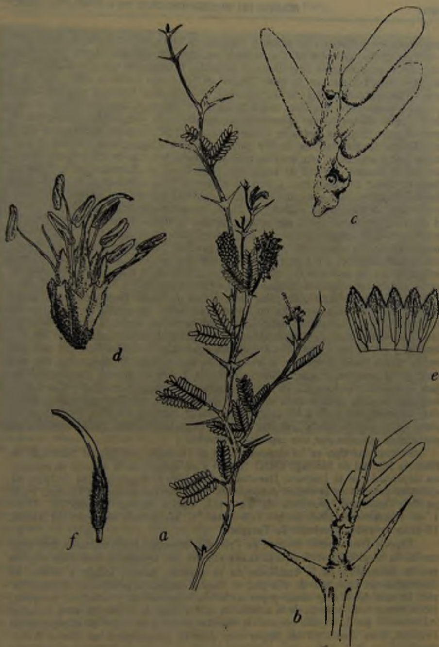
Lámina I: Prosopis burkartii nov. sp. a) Hábito de una rama en flor. b) Detalle de la base de la hoja y espinas. c) Detalle de las pínulas. d) Detalle de una flor. e) Pétalos vistos por dentro. f) Pistilo. Dibujaron Héctor Balbontín C. y Mélica Muñoz S.