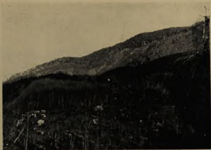
Río Frío. Formas glaciales. Huallería quemada y viejo incendio en las pendientes.