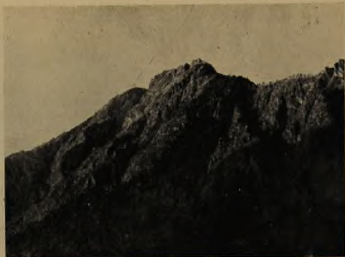
Porfiritas inyectadas. Laguna Tagua-Tagua.