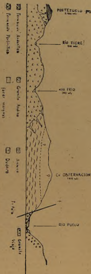
Perfil geológico entre río Puelo (La Junta con el Misno) y Portezuelo a "Lo de Weiler" (Cerro 2,100).