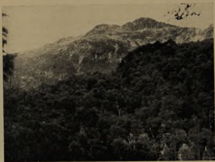
Portezuelo a "Lo de Wieler". Co. 2.100 en el límite con la República Argentina. Formación andesítica.