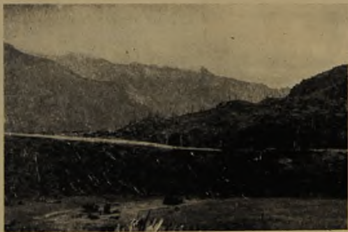
Río Manso. Terrazas aluviales.