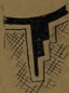
fig. 8. Det. nat.