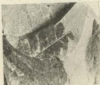
Sticherus (Gleichenia) Asenjoii . 1/1.