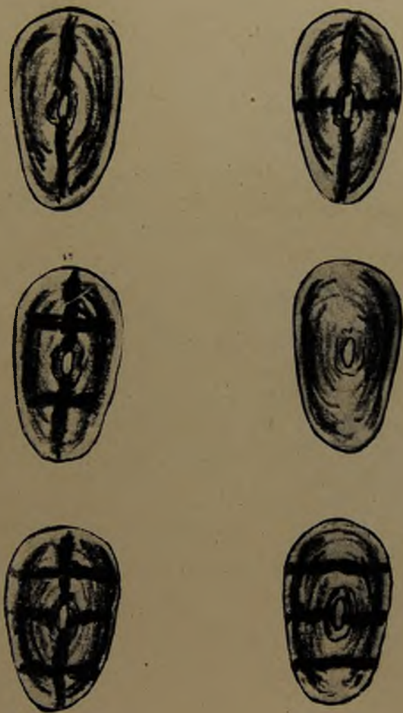
Facsímile en 1/3 del tamaño de las conchas de lapas ( Fissurellas ) que parecen constituir las piezas de un juego