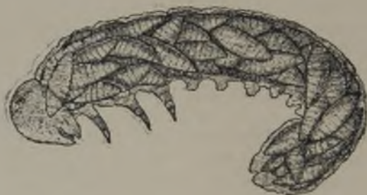
FIG. 67.—Oruga en apariencia sana, pero en realidad llena interiormente de larvas de un himenóptero parásito. ( Segun Berlese )

Cuantas veces nacieron sólo microscópicas avispias de los huevos de mariposas de los que esperábamos ver salir las pequeñas orugas!