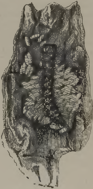
FIG. 71.—Capullos de Apanteles que rodean la oruga muerta. (Segun Howard i Fiske).

lo produce; su afan es unir dos o tres hilos para tener un punto de apoyo que sirva de base a la trama que va a formar en seguida; con teson i perseverancia ella logra su objeto i una vez obtenido, sigue distribuyendo en otras direcciones las hebras de su hilo interminable, pegándolas fácilmente a las ya existentes con solo tocarlas, logrando formar asi una especie de armazon de su capullo; nuevas hebras hábilmente colocadas van dando mas consistencia a la construccion, que aparece ya como una fina i diminuta jaulita ovalada; la pequeña artifice sigue trabajando sin