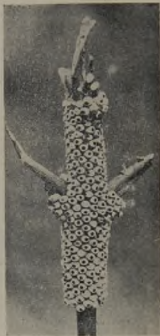
FIG. 63.—Huevos de Dirphia Amphimone , mostrando el agujero de salida del himenóptero parásito. (Original).

que está colocado con la cabeza hacia arriba dentro del huevo, i una vez