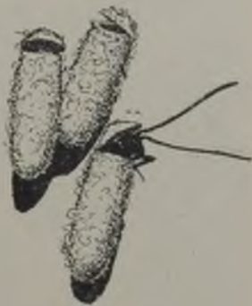
FIG. 72.—Capullos, aumentados, de Apanteles mostrando la manera de salir de los adultos ( Orijinal ).

Las larvas del Apanteles macromphaliae tejen sus capullos a fines de Diciembre o en Enero, i los adultos nacen en Marzo i Abril, para parasitar las orugas de la Macromphalia dedecora Feisth, que abundan en aquellos meses (1). En mis apuntes tengo el siguiente dato ilustrativo: «Las larvas de A. macromphaliae salen de las orugas de Macromphalia el 26 de Abril i dan los imagos el 29 de Octubre»; de manera que en esta jeneracion el período ninfal es de seis meses, mas o menos, i en el caso anterior, de uno i medio a dos meses solamente, lo que se debe a la temperatura del verano.