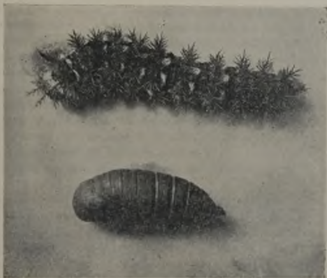
FIG. 69.—Oruga i crisálida de Dirphia Amphimone . tamaño natural (Original)

pelos cortos grises; la cabeza de un negro brillante, cubierta ligeramente de cortos pelos grises; el cuerpo de un negro aterciopelado, manchado de anaranjado, moreno: amarillo; los dibujos amarillos forman bandas trasversales, irregularmente manchadas de negro en la parte anterior de cada segmento, niénos en el segundo; inmediatamente detras de la faja amarilla, en cada segmento, hai seis manojos de cerdas ramificadas; dos en el dorso i