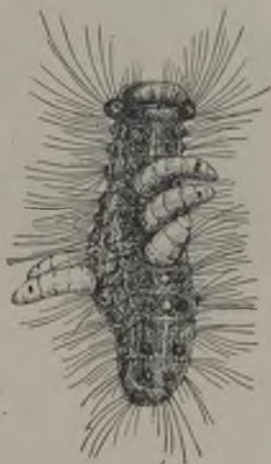
FIG. 70.—Larvas de Apanteles saliendo al exterior a través de la piel de la oruga (Segun Howard i Fiske).

La iniciacion del trabajo para formar este capullo es interesante. La larvita segrega una sustancia viscosa que se endurece al contacto del aire i forma un hilo trasparente; ella empieza a efectuar grandes oscilaciones, moviendo en un amplio círculo el extremo del cuerpo por donde sale el hilo que nunca se corta ni concluye, como si fuera inagotable la fuente que