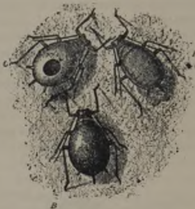
FIG. 64.—Grupo de pulgones: A, insecto sano; B, insecto atacado por el parásito; C, ampolla disecada de otro insecto del cual ya ha salido el himenóptero parásito. (Segun Berlese).

Otro gran enemigo del pulgon del rosal, aunque no propiamente parásito, son las larvas de las moscas de la familia de los Sirfidos. Tienen el aspecto de una pequeña babosa de color pardo oscuro, con tinte morado,