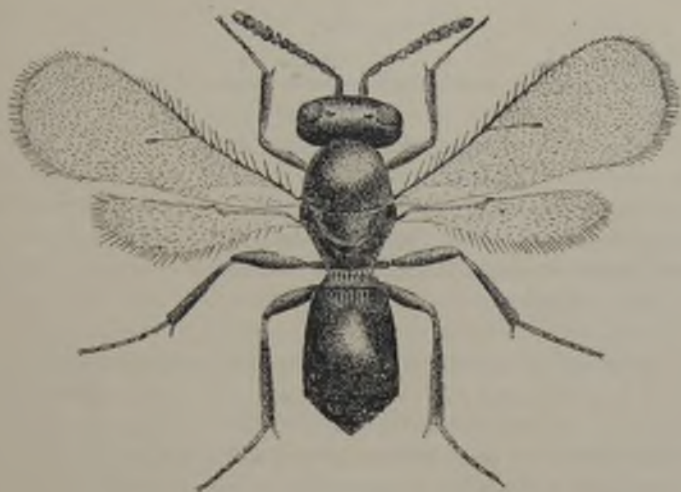
FIG. 74.— Paridris chilensis BRÈTHES, mui aumentado. ( Original )