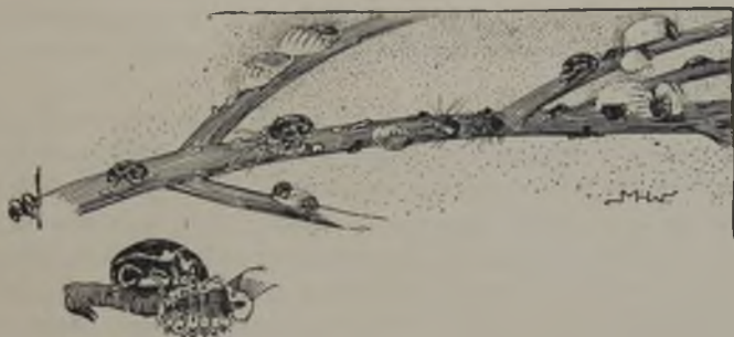
FIG. 66.—La Icerya purchasi atacada por el coccinérido australiano Novius cardinalis . (Segun Kellogg)

Otro ejemplo no ménos notable lo tenemos en el Diaspis pentagona Targ. cóccido sumamente pernicioso para las arboledas i plantaciones en jeneral, i la Prospaltella Berlesei How. un microhimenóptero de la tribu