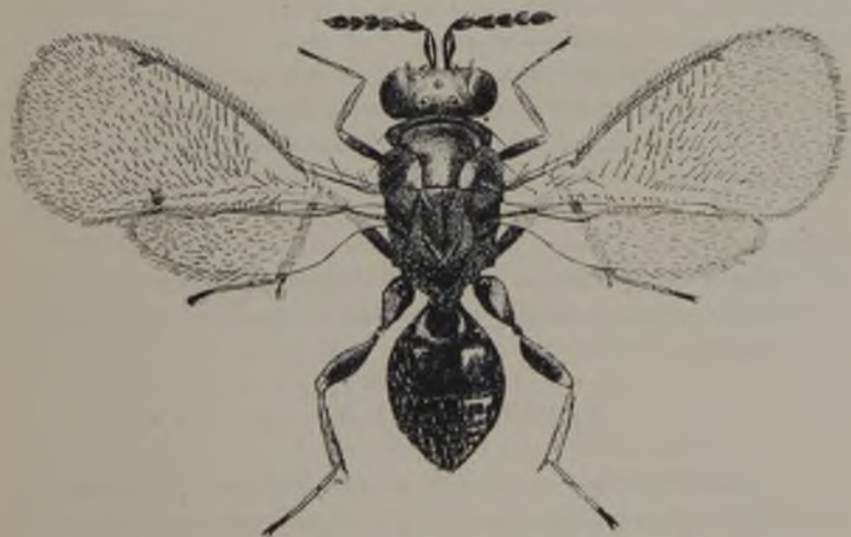
FIG. 75.— Diaphlogus ancilla (W. K.) BRÈTHES, mui aumentado. ( Original )