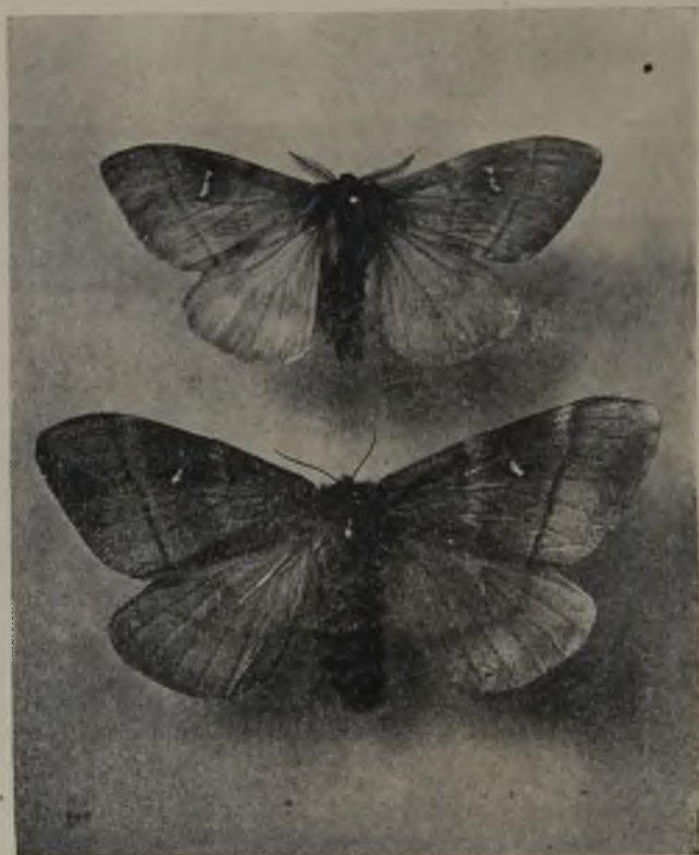
FIG. 68.— Dirphia Amphimone (F.) BERG ♂ i ♀, tamaño natural (Original)

por Mr. Blanchard debe referirse al género Dirphia Hb., siendo el nombre verdadero de la mariposa el que hemos colocado mas arriba. Ademas, dice el señor Blanchard al crear su género Ormiscodes , que se distingue netamente de todos los otros Bombicianos, «por la brevedad de la cabeza i de los palpos, i sobre todo por la forma de las antenas, que son casi las