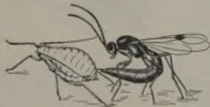
FIG. 63.—Un aphidido atacando a un pulgon. (Segun Howard i Fiske)

Entre sus parásitos mas comunes i eficaces se encuentran las especies del jénero Aphidius , himenópteros de la familia de los Braconidos. En