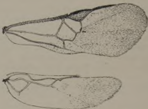
FIG. 76.—Alas de Apanteles Hoffmanni Silva ( Original )

Tipo: 4 ejemplares en la coleccion del Museo Nacional.