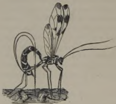
FIG. 62.—Himenóptero atravesando con su taladro la corteza de un árbol para colocar su huevo en la galería en que se oculta la larva de su mesonero. (Segun Kellogg).

Nada ni nadie impedirá a la madre que encuentre a la víctima que deberá sacrificar en holocausto a su decendencia! Que la víctima, escondida en el follaje de los árboles, se halle defendida por un caparazon ceroso que ella misma secreta para que le sirva de escudo protector (como sucede en los Coccidos), pues la pequeña avispita, casi invisible, dará con ella i atravesará con su oviscapto el escudo de cera para depositar sus huevos en el cuerpo de su adversario! Que la larva a cuyas espensas deben desarrollarse los huevos del himenóptero, se encuentre trabajando una galería bajo la corteza de un árbol, pues el ichneumónido, adivinando con certeza maravillosa el sitio exacto que ocupa, atravesará con su taladro, como si