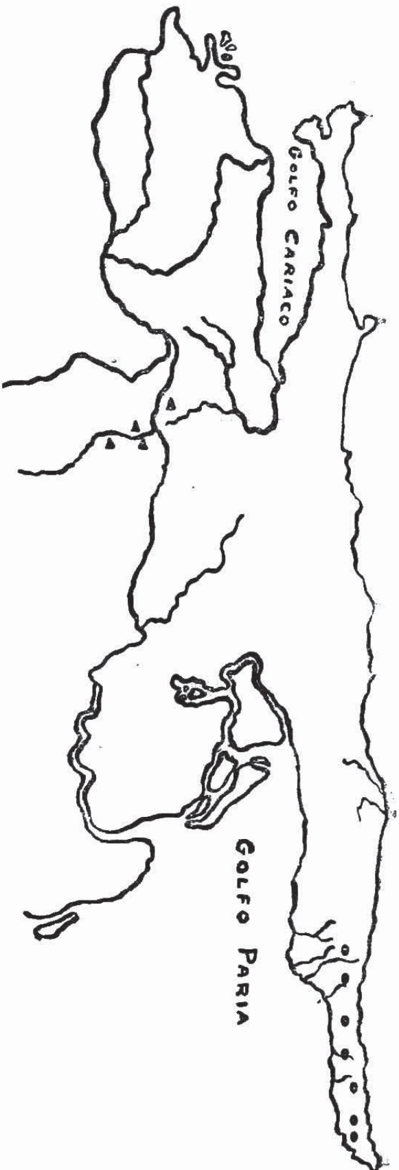
Distribución de Gonatodes (Estado Sucre: Venezuela). Triángulos: Gonatodes seigliei . Círculos: Gonatodes ceciliae .