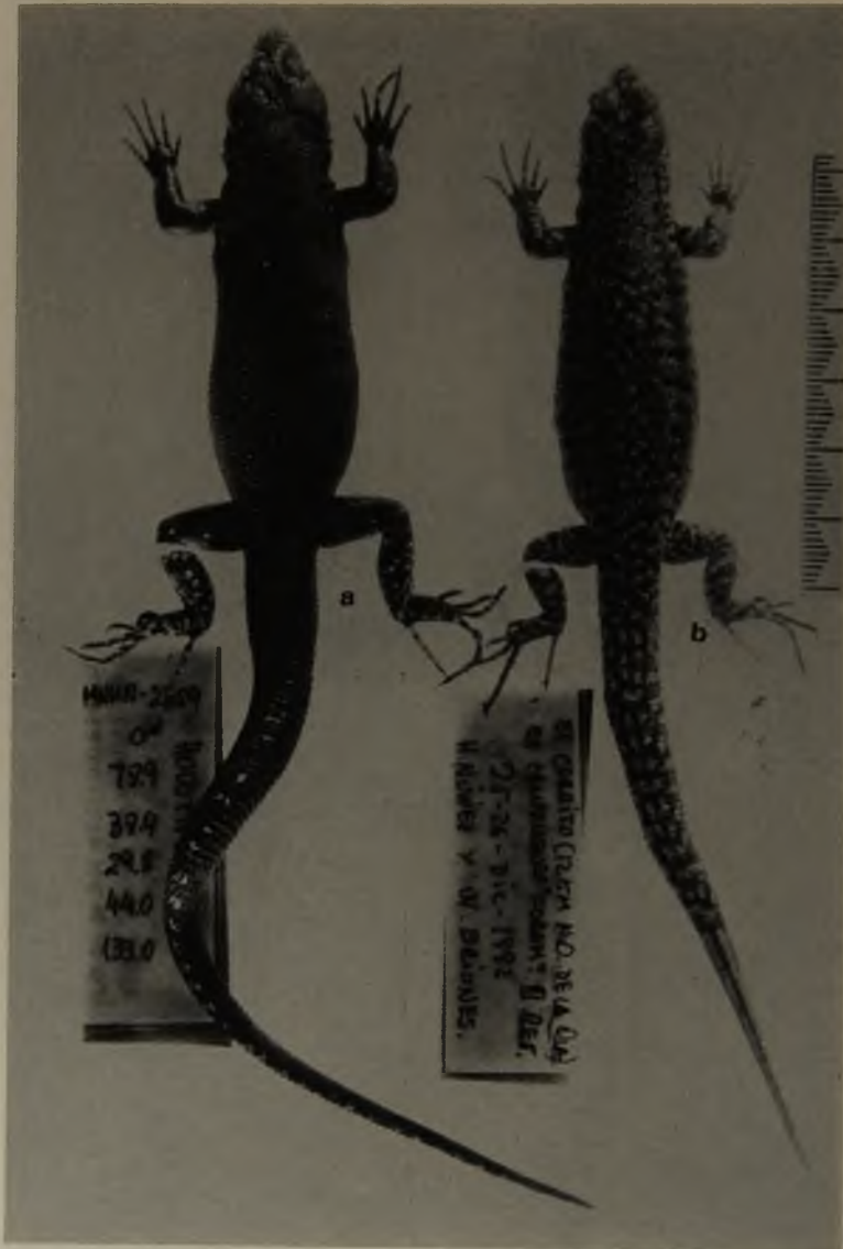
Figura 3a) Holotipo de Liolaemus isabellae ; macho MNHN-2359. b) el alotipo; hembra-2360. Nótese la similitud de esta hembra con el diseño dorsal de las hembras de Liolaemus nigroviridis (véase texto para detalle).