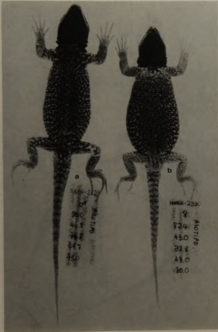
Figura 2a) Holotipo de Liolaemus patriciaturrae en vista ventral. Nótese la garganta y pecho melánicos. b) Alotipo de la especie. Las áreas melánicas están restringidas al sector gular.