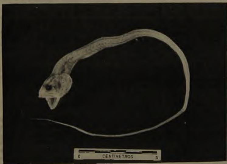
Fig. 3. Echiodon cryomargarites Markle, Williams y Olney, 1983. MNHC P. 6426