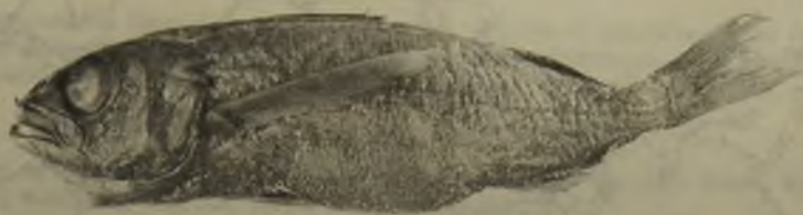
Fig. 2. Scombrobrax heterolepis Roule, 1922. MNHC P. 6415