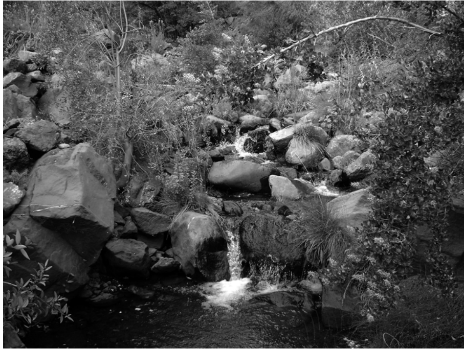
Figura 4. Hábitat de A. montanus rumbo a las termas del Flaco, San Fernando.