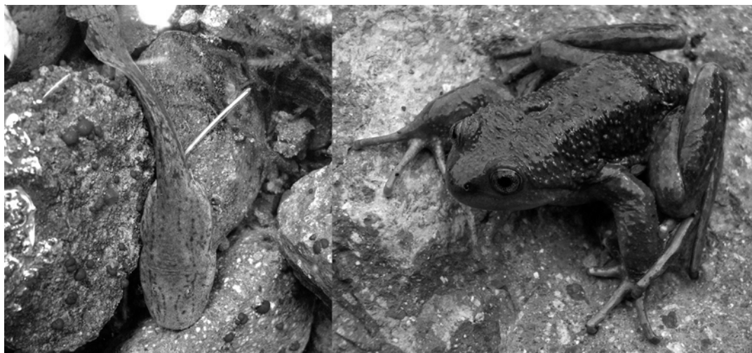
FIGURA 2. Individuos de A. montanus procedentes de la cordillera de San Fernando, VI Región. A) Larva de la especie en estadio 36 (Gosner 1960). B) macho adulto (DBCGUCH 0803016).