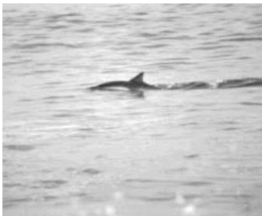
FIGURA 2. Avistamiento de Delphinus sp., a pocos metros de la orilla de playa.

Referente a la distribución longitudinal del género, los dos individuos que permanecieron 19 meses en la poza artificial del puerto de Antofagasta (Guerra et al. , 1987), los dos individuos avistados durante casi un año frente a Caleta Coloso (Guerra et al. , 1987) y los tres individuos avistados a orillas de la playa Punta Arenas, I Región (este trabajo – Figura 2), durante al menos nueve horas, indican que estos delfines pueden presentarse también en el borde costero. Lamentablemente, estos registros no permiten determinar si tal conducta corresponde a una o ambas especies descritas para el país.