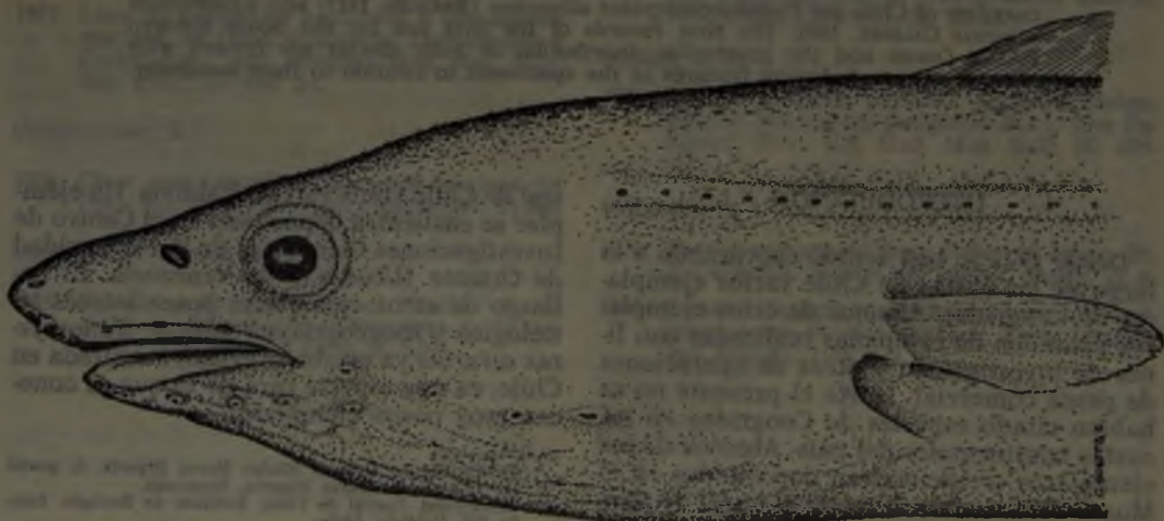
Figura 1. Pseudoxenomystax albescens , Chile, Cordillera sumergida de Juan Fernández. Vista lateral de la cabeza.

Color: gris acerado uniforme, más claro ventralmente. Toda la dorsal con un borde negro destacado que se ensancha en la región caudal y es muy fino en la anal hasta casi desaparecer en la parte anterior. Pectoral moteada de pardo.