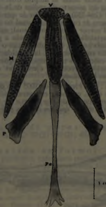
Figura 3: Disposición y dentición de algunas piezas óseas del techo de la boca de Pseudovenomystax albescens ; M = maxilar; P = palatino (auto-palatino); P = paraesfenoides; V = vómer, de la cabeza diafanizada del ejemplar IZUA-PM: 782.

El origen de la dorsal se encuentra a nivel del 7° u 8° poro de la línea lateral ligeramente por delante de la pectoral o al mismo nivel. La abertura branquial se inicia casi a nivel de la base del último o penúltimo radio de la pectoral. En el labio superior apenas si se insinúa pliegue; en el labio inferior el pliegue está claramente definido.