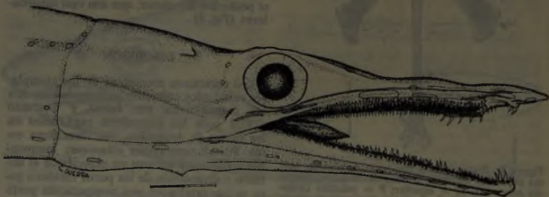
Figura 4. Xenomystax atrarius . Ejemplar de la región de Coquimbo.

T a l l a : El ejemplar de 1005 mm de L.T., 990 mm de L. estándar es ligeramente inferior al mayor citado por CASTLE de Nueva Zelandia y mayor que los citados por LÓPEZ