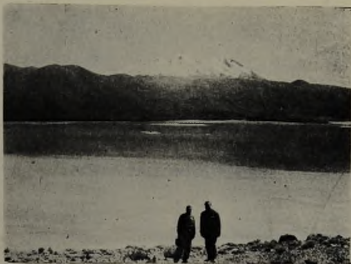
Salar San Martín con Volcán Aucanquilcha