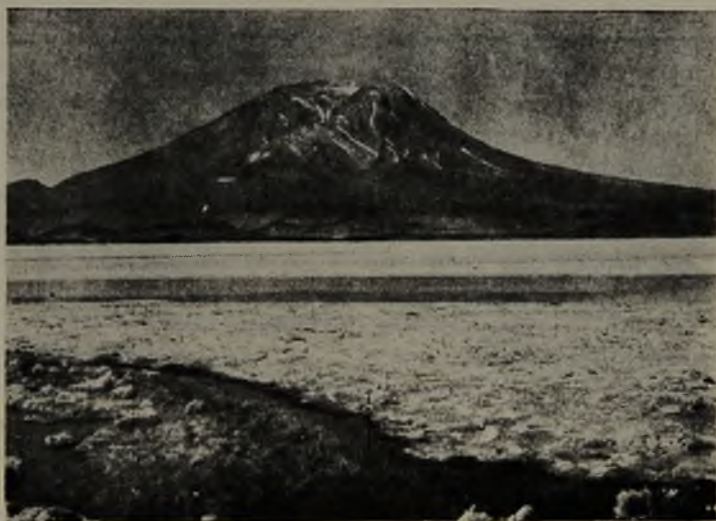
Vertiente termal Cuchiça, Salar San Martín, con volcán Ollagüe