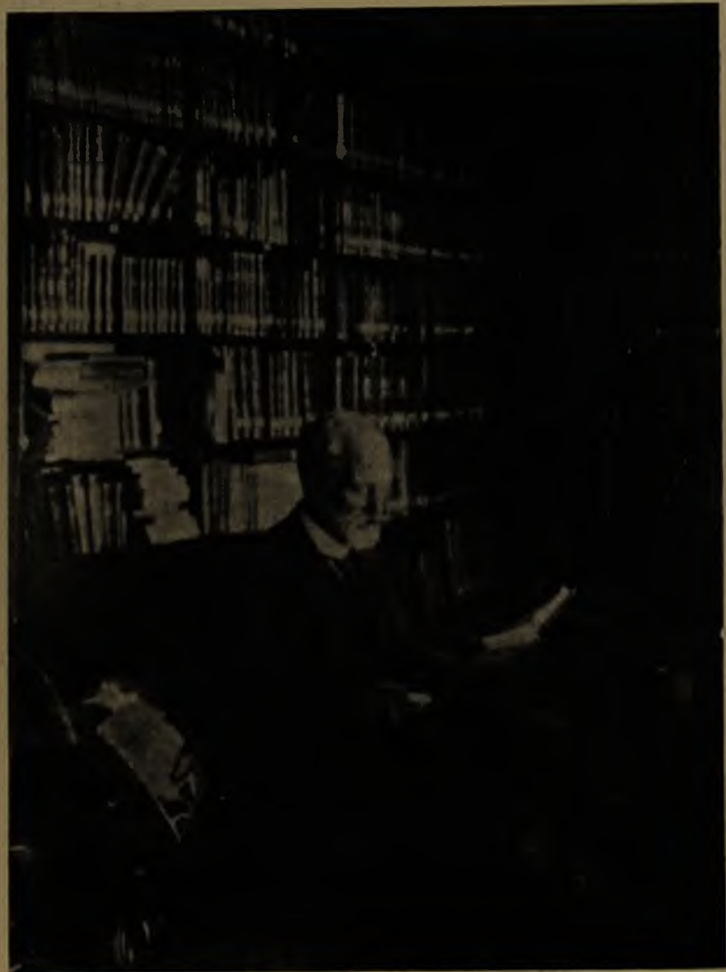
Don FEDERICO PHILIPPI

En su Biblioteca, que fué comprada para que forme parte de la del Museo Nacional "no sólo como en homenaje a la memoria de Philippi, sino como un material indispensable en todos los trabajos de investigación científica".