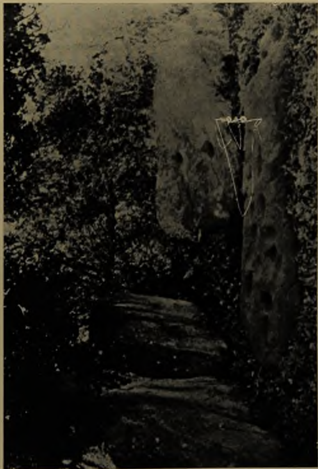
El Retiro, Grupo II de las Piedras con Tacitas. Piedras A y B.