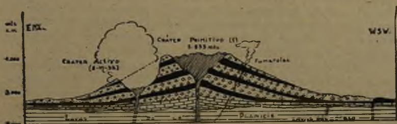
Fig. N.º 3.—Corte esquemático del Descabezado Grande.

responde a una traquita, otra obscura, formada principalmente por obsidiana dispuesta en lechos de fluidalidad, alternando con otros en los cuales la obsidiana no se advierte. Estas lavas tienen abundantes minerales de sanidina. Corresponderían pues, a otra manera de presentarse la misma roca. Mientras las primeras son las que intervienen en el cono, las últimas aparecen en el cráter, según puede desprenderse de las pocas observaciones que se han podido hacer en el aparato mismo.