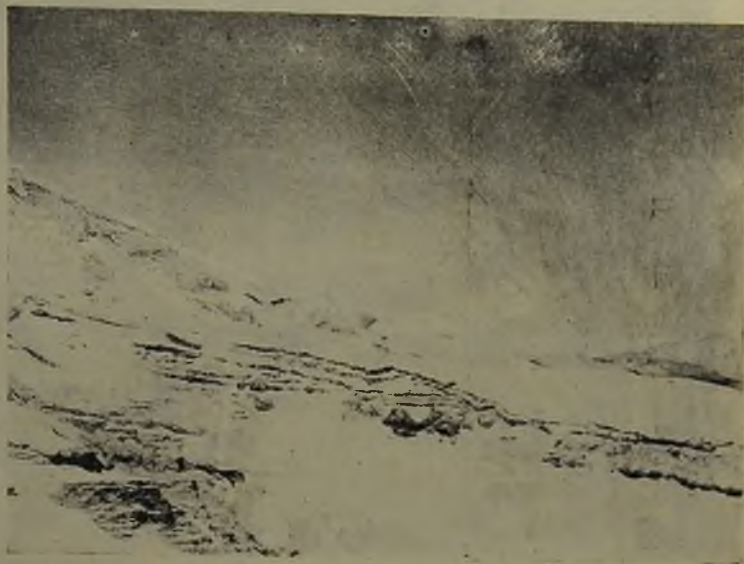
Fig. N.º 1.—Lavas de la Planicie recubiertas por lavas del zócalo.