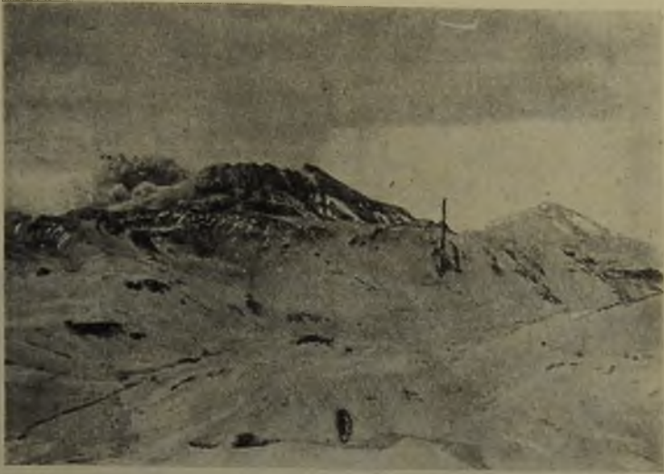
Fig. N.º 6.—El Descabezado Grande y el Cerro Azul, desde El Alto Pelado.