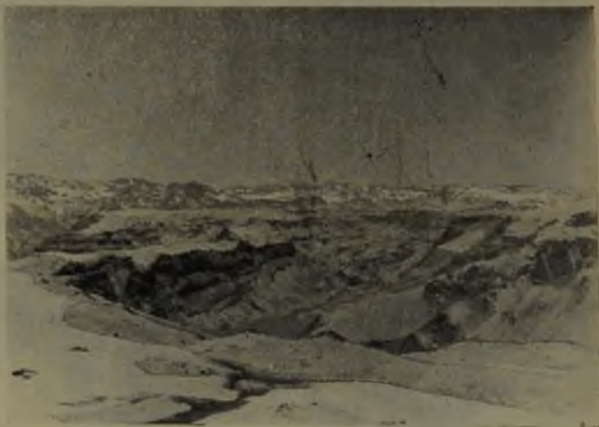
Fig. N.º 8.—La Laguna de Mondaca y las lavas de la Planicie.