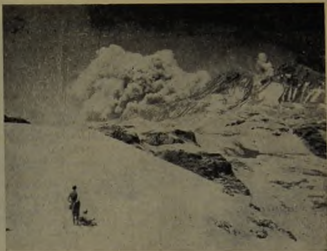
Fig. N.º 4.—Vista frontal del Descabezado Grande con su dráter activo y las fumarolas. Enero de 1932.