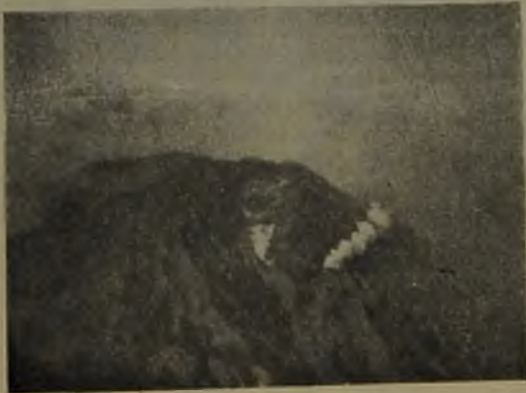
Fig. N.º 7.—Cráter primitivo y fumarolas. V-1932.