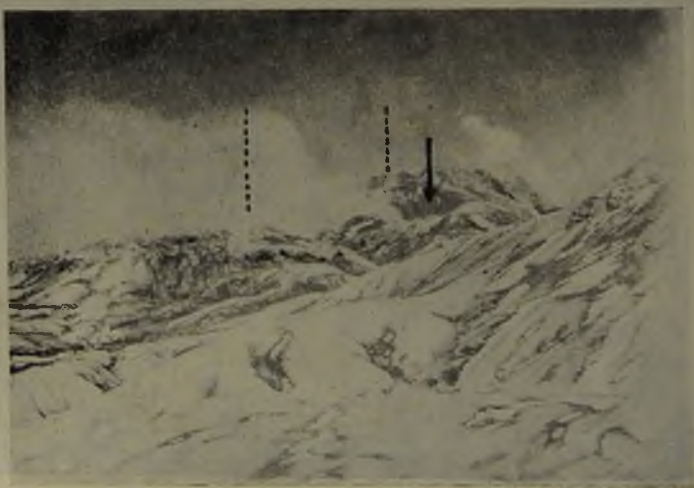
Fig. N.º 5.—El Descabezado Grande visto desde el norte. Cráter inactivo y cráter activo en esa vertiente.