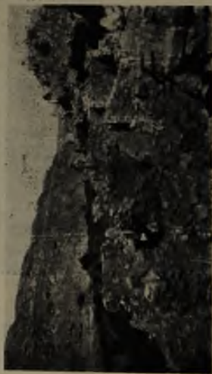
Vistas parciales de Lasana