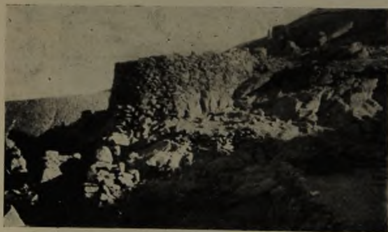
Vistas de las ruinas de San Pedro de Atacama